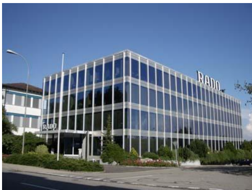
Rado Uhren AG

Die Einwohnergemeinde Lengnau BE ist ein interessanter Wirtschaftsstandort, wo zahlreiche Industriebetriebe zu finden sind.