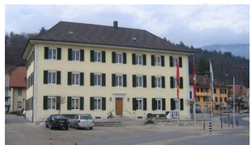
Das Gemeindehaus am Dorfplatz

Die Verwaltung ist im Gemeindehaus und einem Nebengebäude untergebracht. Seit dem 1. Januar 2004 ist sie nach einem Geschäftsleitermodell mit fünf Abteilungen (Präsidial-, Finanz-, Bau-, Sozial- und Schulabteilung) organisiert. Die Einwohnergemeinde Lengnau BE beschäftigt 50 Personen.