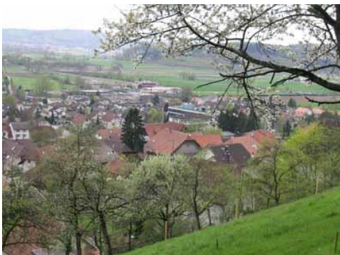
Das Dorf von Norden

Das Dorf präsentiert sich mit der neuen Begegnungszone in einem neuen Kleid und lädt die Bevölkerung zum Flanieren ein.