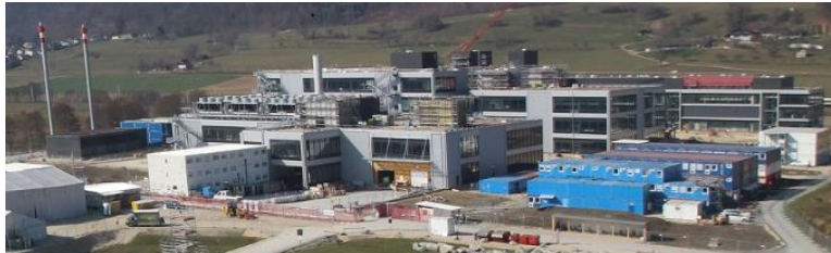
Der Neubau der CSL Behring Lengnau AG / Thermo Fisher Scientific Inc.

Im Jahr 2014 erhielt die Einwohnergemeinde Lengnau BE von über 45 geprüften Standorten auf der ganzen Welt den Zuschlag der CSL Behring Lengnau AG.