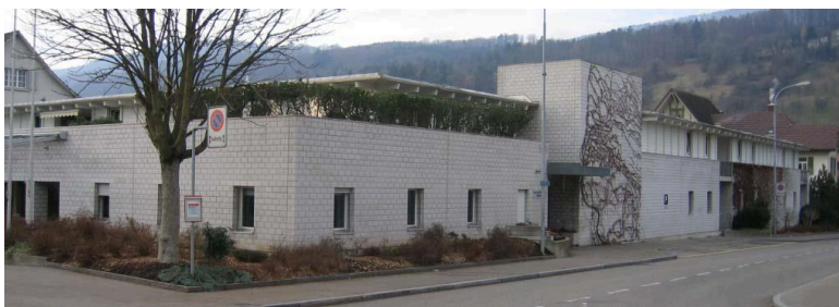
Das Alters- und Pflegeheim Sägematt im Zentrum von Lengnau

Die ältere Generation kann ihren Lebensabend im Alters- und Pflegeheim Sägematt verbringen. Das Alters- und Pflegeheim Sägematt ist zentral, nahe des Bahnhofs, gelegen. Es bietet Raum für 50 betagte oder pflegebedürftige Personen aus Lengnau und Umgebung. Seit 2005 gibt es eine Wohngruppe mit 12 Plätzen für Demenzzranke. Je nach Belegung sind auch Ferien- und Tagesaufenthalte möglich. Das Restaurant im Alters- und Pflegeheim Sägematt ist täglich geöffnet. Die Begegnungen im Restaurant, die permanenten Ausstellungen und weitere Aktivitäten ermöglichen den Pensionären, den ständigen Kontakt mit der übrigen Dorfbevölkerung zu pflegen.